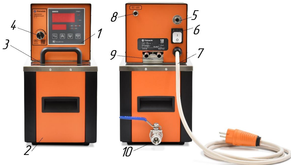
Рис. 1 Конструкция прибора

6.1.1 Внешний вид прибора показан на рисунке 1;